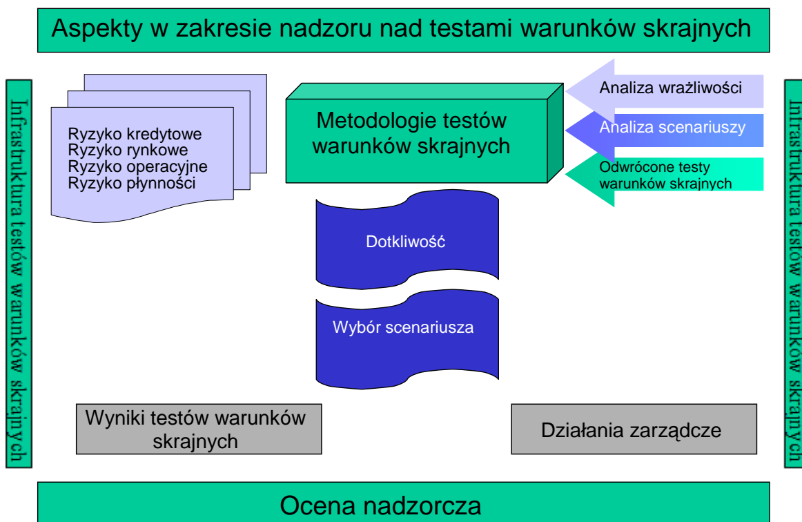
Rysunek 1. "Modułowe" podejście do wytycznych